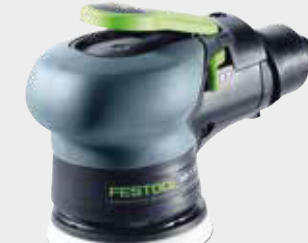
Festool LEX 3 77