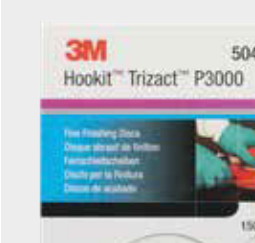
Disco de Acabamento 3M™ Trizact™ 3000

▶ Afine os riscos com um Disco de Acabamento 3M™ Trizact™ 443SA, grão 3000, 150 mm com uma lixadora roto orbital. ▶ Afine os riscos com um Disco de Acabamento Fino 3M™ Trizact™ 443SA, grão 8000, 150 mm com uma lixadora roto orbital.