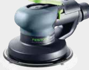
Festool LEX 3 150/3