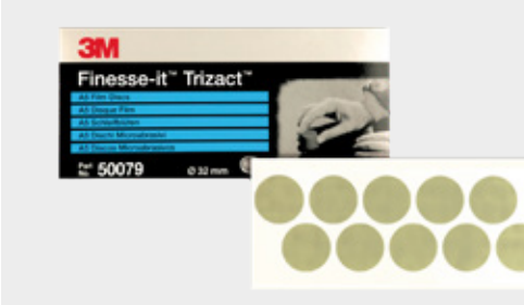
Discos 466LA Trizact™ A5 3000

▶ Remover defeitos com o disco 3M™ Finesse-it™ Trizact™, 32 mm grão 3000 na ferramenta de remoção de defeitos.