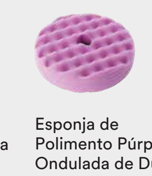
Esponja de Polimento Púrpura Ondulada de Dupla Face 3M™ Perfect-It™ Quick Connect