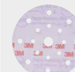
3M™ Hookit™ 260L+

▶ Lixe a área com um Disco Abrasivo 3M™ Hookit™ 260L, grão P1500 - P2000.