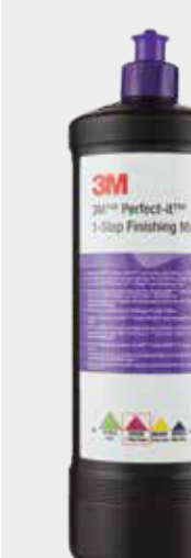
Polimento de 1 Passo 3M™ Perfect-It™

▶ Volte a polir a área, para assegurar que é obtido um acabamento de alto brilho, sem ser necessário aplicar composto adicional na esponja. ▶ Faça o polimento da área e zona circundante seguindo um padrão de sobreposição com velocidade rotativa de 600-1400 rpm. ▶ Mantenha a esponja de polimento plana na superfície para garantir uma aparência uniforme e um acabamento brilhante, reduzindo a pressão no final da etapa de polimento. ▶ Limpe o excesso de produto de polimento e verifique a área – na maioria das cores estará bem neste momento. ▶ Para cores críticas (muito escuras ou preto) - remova os hologramas usando o Polimento 3M™ Perfect-It™ Ultrafina SE e esponjas de polimento azuis.