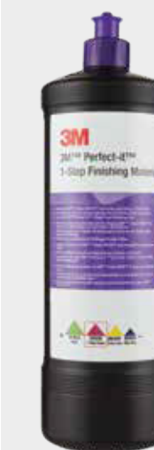
Polimento de 1 Passo 3M™ Perfect-It™

Nota: Quanto mais macio for o revestimento, mais baixa tem de ser a temperatura e, portanto, também as RPM.