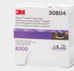
Disco de Acabamento 3M™ Trizact™ 8000

▶ Afine os riscos com um Disco de Acabamento 3M™ Trizact™ 443SA, grão 8000, 75 mm com uma lixadora roto orbital.