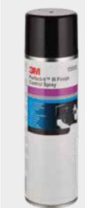
Spray de Controlo de Acabamentos 3M™ Perfect-It™

Nota: É importante garantir a remoção de todos os riscos de lixagem nesta etapa, a fim de evitar que voltem a aparecer no final do processo de polimento.