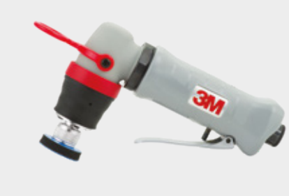
Mini Lixadeira Roto Orbital 3M™, Pressão de Ar