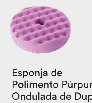
Esponja de Polimento Púrpura Ondulada de Dupla Face 3M™ Perfect-It™ Quick Connect