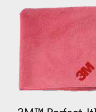
3M™ Perfect-It™ Alto Desempenho Rosa Microfibra Ultra Macia