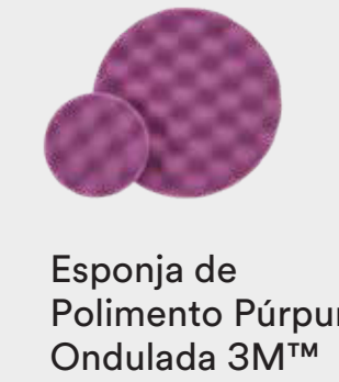
Esponja de Polimento Púrpura Ondulada 3M™ Perfect-It™ Hookit