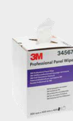
Toalhas Profissionais para Painéis 3M™