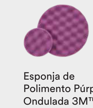
Esponja de Polimento Púrpura Ondulada 3M™ Perfect-It™ Hookit