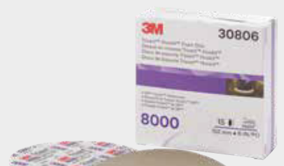
Disco de Acabamento 3M™ Trizact™ 8000